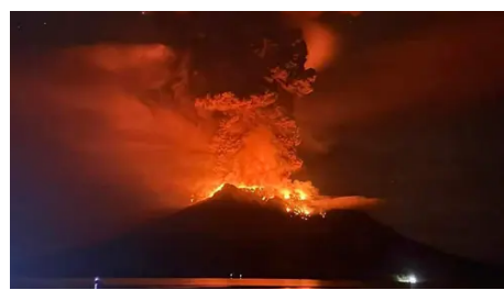
Aachener-Zeitung.De Tsunami-Warnung nach heftigem Vulkanausbruch in Indonesien