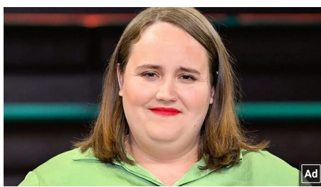
Usfoodsearch Ricarda Lang ist mit dieser Schönheit verheiratet